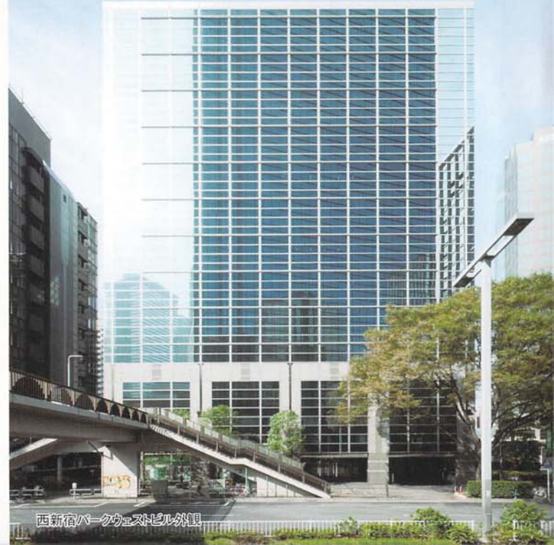
西新宿パークウエストビル外観