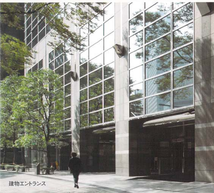
建物エントランス