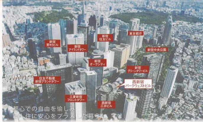
都心での自由を愉しみ、 暮らしに安心をプラスした暮らし。 西新宿超高層ビル街の空撮